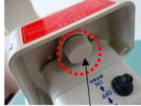
<사진-5> 모터 고정 나사