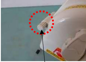
<사진-3> 커버 고정 나사