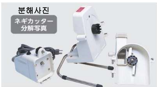
모터 -- 부 스탠드-부 커버-부