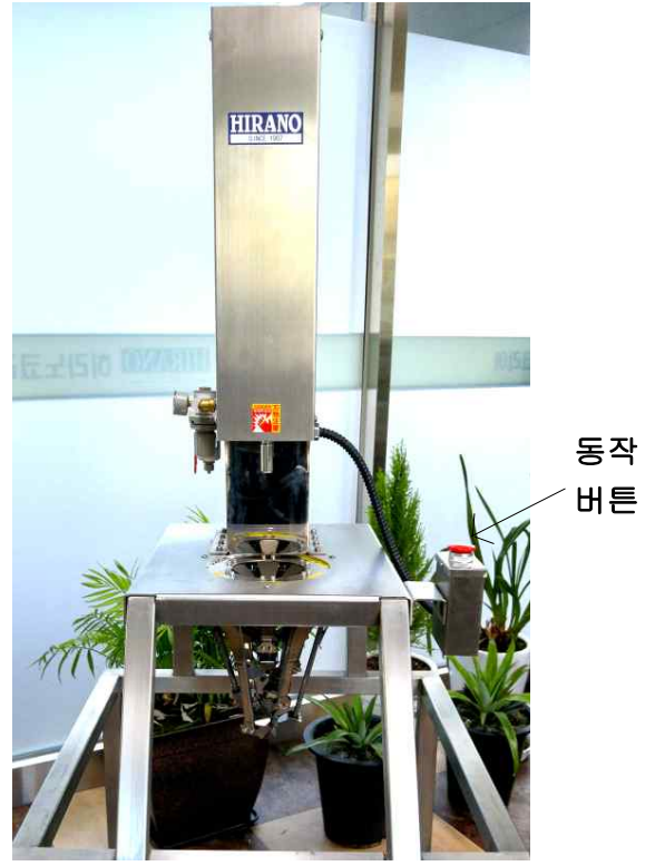
<자동식 무 탈피기>